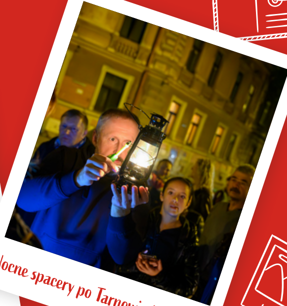
Nocne spacery po Tarnowie i regionie